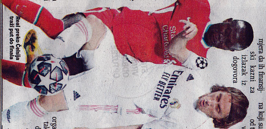
Real preko Čelsija traži put do finala

gazdovala takmičenjem i dalje postoji, a postoji i plan kako da ona "potkopava" UEFA. Iako je šest timova iz Premijer lige napustilo ideju o Superligi (Manchester Siti i Jurajted, te Čelsi, Liverpool, Arsenal i Tottenham), u Španiji se i dalje ne odustaje od ovoga. Mozak svega je Pérez, tako da